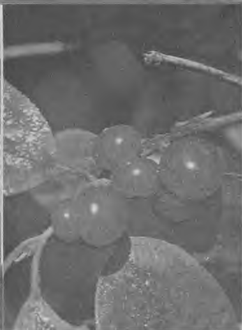
Плоды жимолости лесной