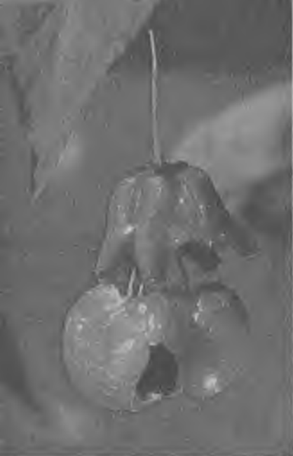
Плод бересклета бородавчатого

Цветки бересклета в противоположность плодам мало заметные, небольшие. В каждом из них четыре коричневатых лепестка, расположенных наподобие креста. Посмотришь на цветки — они какие-то странные, будто не живые, а восковые. Когда бересклет цветет, его сразу можно обнаружить в лесу по запаху, но запах этот специфический, не совсем приятный. Цветение начинается примерно в то же время, что у ландыша, и продолжается несколько недель.