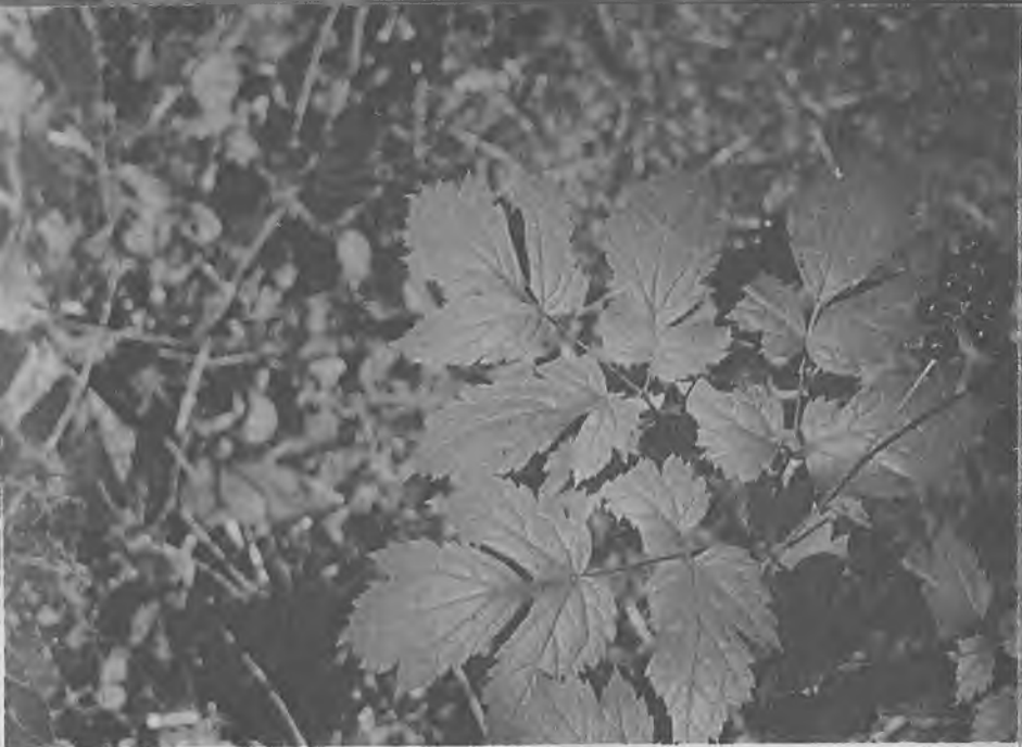
Воронец колосистый (растение с плодами)

с помощью малинового красителя (он находится в большом количестве в наружных клетках). Доказать это очень просто. Вспомните хотя бы, какое бывает варенье из черной смородины. Оно ведь не черное, а темно-малиновое. И получается так оттого, что красящее вещество ягод растворяется в сахарном сиропе при варке.