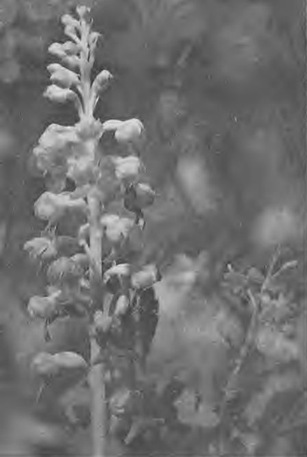
Часть соцветия гнездовки

Свет для жизни растения не нужен, он не играет никакой роли в питании.