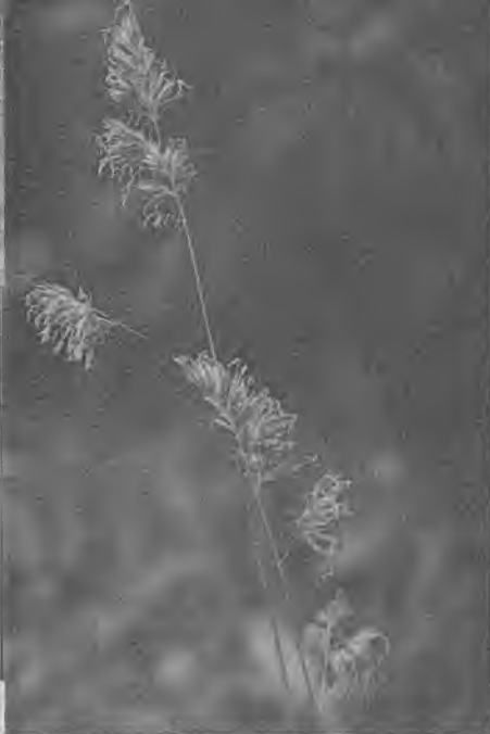
Соцветие ежи сборной

Вот один из них — ежа сборная. Длинный прямой стебель этого растения заканчивается характерным соцветием. Тип соцветия — метелка, но она необычна: состоит как бы из нескольких комков, сгустков, каждый из которых сидит на конце тонкой веточки. У ежи есть и другая отличительная особенность — совершенно плоские, точно проглаженные утюгом, нецветущие стебли. Такие короткие стебельки с листьями обычно можно найти у основания длинного цветущего побега. Ежа — один из самых распространенных луговых злаков.