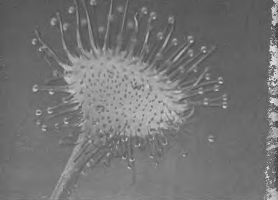
Лист росянки с железистыми волосками

ки. Живет росянка в необычных условиях — на зыбкой живой «почве», которая все время поднимается. Стебельки мхов ежегодно нарастают в высоту, и мхи грозят со временем поглотить росянку. Но у растения выработалось приспособление для борьбы с этой угрозой. Вот в чем его суть. Ежегодно росянка образует на верху корневища новую розетку листьев, а старые листья отмирают. И каждый год корневище подрастает вверх ровно настолько, насколько поднимается моховой ковер. Поэтому розетка молодых листьев всегда оказывается на поверхности мха. Таким путем росянка, «шагая в ногу» с нарастанием мхов, избавляется от грозящей ей опасности.