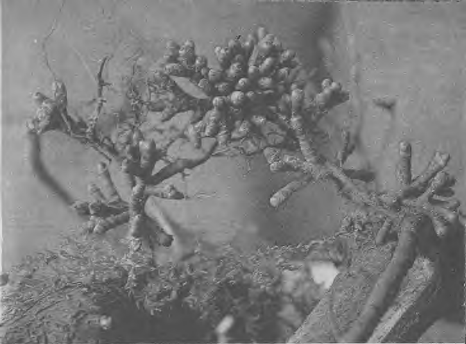
Клубеньки на корнях серой ольхи

Между тем об ольхе можно рассказать много интересного.