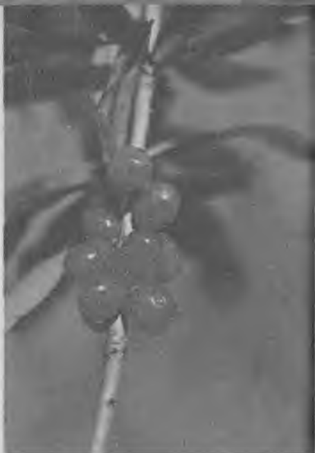
Плоды волчьего лыка

Красные сочные плоды имеет и волчье лыко. Яркие, блестящие шарики прямо просятся в рот. Но нельзя забывать, что они ядовиты. Плоды, как и цветки, точно наклеены на ветки. Правда, плодов созревает обычно гораздо меньше, чем было цветков. Особенно мало их завязывается в глубине леса, где густая тень. Созревают плоды в июле — начале августа.