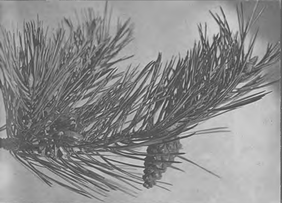
Ветвь сосны с шишками разного возраста

один вопрос по поводу фотографии: сможете ли вы, глядя на снимок, сказать, какая погода была во время съемки — дождливая или засушливая?