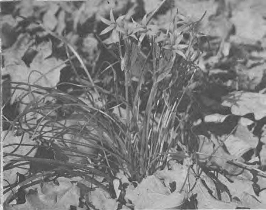
Гусиный лук малый

сучок. Эта подземная часть растения имеет такое же назначение, как и клубень хохлатки. Если разломить корневище, видно, что оно внутри белое, крахмалистое. Тут хранятся запасы питательных веществ.