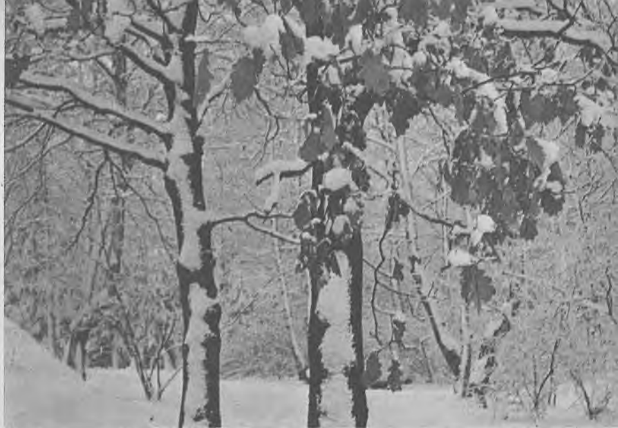
Дуб, не сбросивший листья на зиму

вьев. Именно к таким «сухопутным» водорослям относится и трентеполия. Жизнь ее удивительна, необычна. Она проходит как бы вспышками. Выпал дождь — растение живет полной жизнью, все жизненные процессы идут полным ходом. Стало сухо — жизнь замирает, растение словно впадает в спячку. Крохотные клетки намокают и высыхают много раз, но тем не менее остаются живыми. Не погибают они и от зимних морозов. Именно благодаря такой необычайной выносливости и живет трентеполия на коре деревьев.