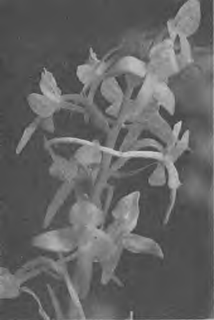
Цветки любки двулистной

тересная деталь — так называемый шпорец. Это тонкий и длинный отросток в виде трубочки, закрытой на одном конце. Он несколько напоминает миниатюрные ножны для шпаги. Внутри шпорца — бесцветный сладкий нектар. Благодаря множеству торчащих во все стороны длинных шпорцев соцветие любки кажется каким-то лохматым.