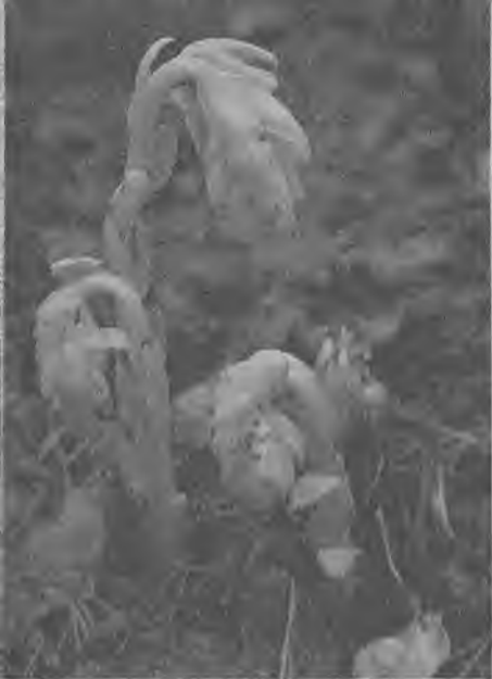
Подзельник — цветковое растение, лишенное зеленой окраски