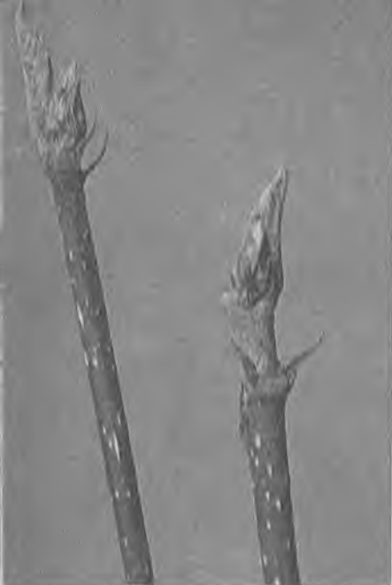
Почки крушины ломкой

колпачок (такую форму имеет единственная почечная чешуя, других у ив нет). А у липы каждая почка закрыта двумя чешуями.