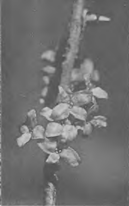
Волчье лыко (ветвь с цветками)

ко «волчье», а не какое-нибудь другое, сказать трудно. Может быть, потому, что кора имеет сильно жгучий вкус и к тому же ядовита.