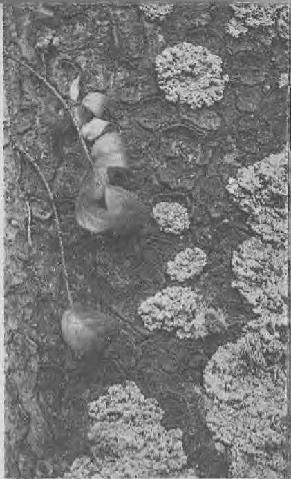
Лишайники на коре дерева

В чем же тут дело? Оказывается, лишайники крайне чувствительны к загрязнению воздуха. Их отравляют некоторые газы, которые выходят из труб заводов и фабрик, из топок. Особенно ядовит для них сернистый газ. Даже небольшая его примесь оказывается губительной. Коротко говоря, лишайники — своеобразные и очень чувствительные «барометры» чистоты воздуха. Если их много на деревьях, можно с уверенностью сказать, что воздух свободен от промышленных газов.