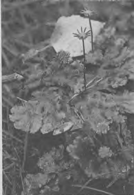
Маршанция — представитель мохообразных

Откуда же берется на кострищах маршанция? Как она туда попадает? Зеленые пластинки ее вырастают из тех спор, что приносит на кострище ветер. Таким же путем попадают на кострища и настоящие мхи.