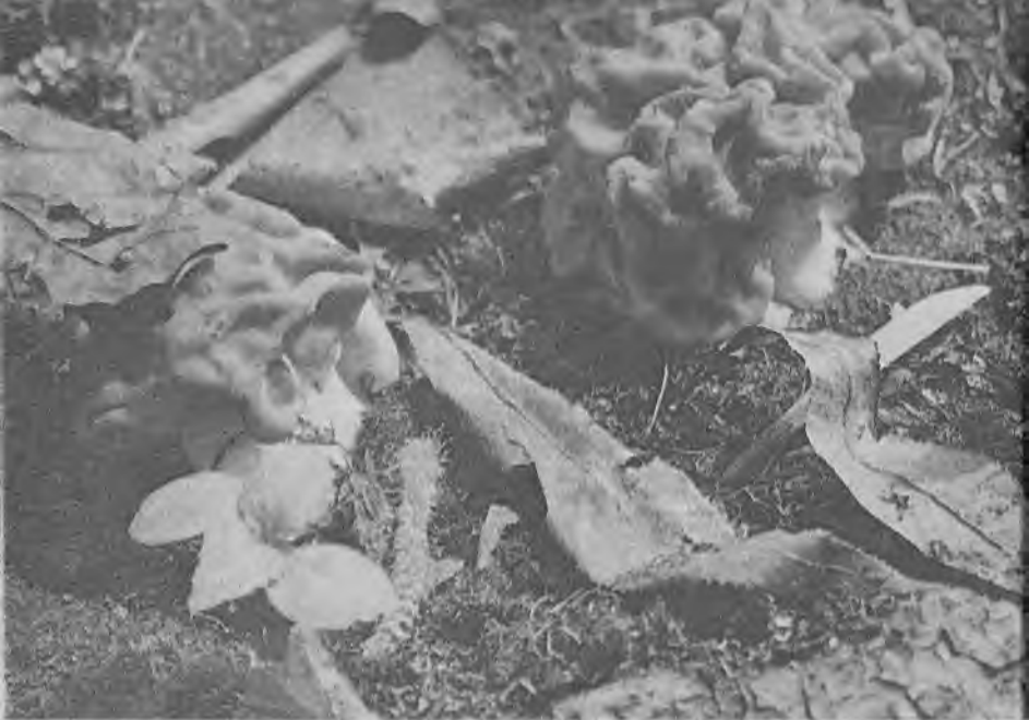
Весенний гриб строчок обыкновенный

совсем особая, покрыта мелкими извилистыми складками, которые не образуют ячеек. А главное, здесь самая настоящая шляпка, она, как колпачок или наперсток, надета на ножку и прикрепляется только в середине. Попробуешь оторвать — легко отделяется, нечаянно уронишь гриб — то же самое. Если сорвать гриб целиком, видно, что ножка у него довольно длинная, в несколько раз превышающая шляпку. Вверху она тоньше, книзу немного утолщается. Сморчковая шапочка также относится к сумчатым грибам. Кто-то из читателей, наверное, поинтересуется, съедобны ли наши грибы-подснежники и где их можно найти. Все перечисленные грибы съедобны и вкусны, но только строчки и сморчки надо сначала отварить в кипящей воде в течение 10—20 минут, а потом уж жарить. Сморчковая шапочка пригодна для жаркого и без такой предварительной подготовки.