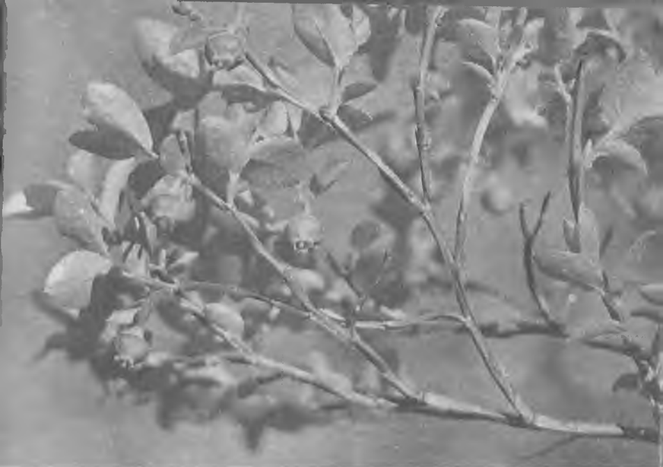
Черника в цвету

небольшое отверстие, обрамленное по краям пятью маленькими зубчиками. Из отверстия торчит наружу крохотная тонкая палочка — столбик пестика. Каждый цветок висит на короткой цветоножке, словно фонарик.